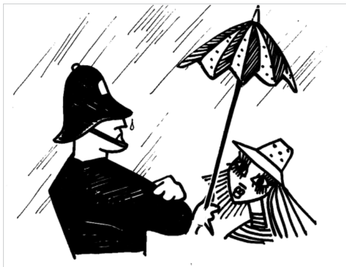
Рис. 2. Энн и Бобби