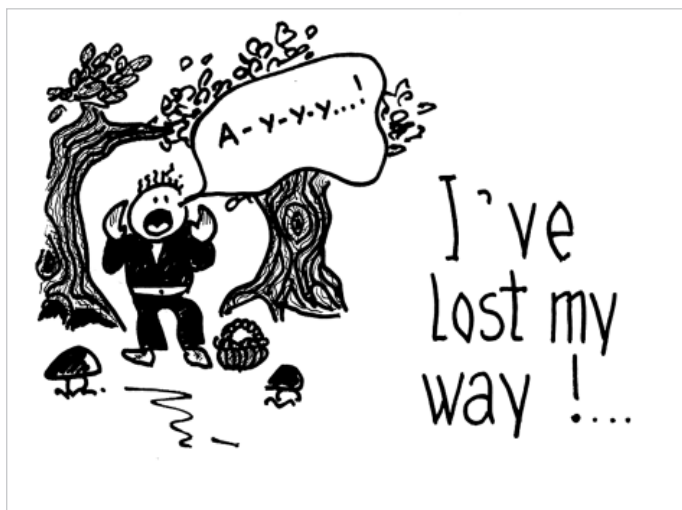
Рис. 1. Фраза "I've lost my way!"

Формы организации занятий, на которых происходит введение лексики, различны. С одной стороны, обучение лексике может быть побочной задачей видеозанятия, примером тому служит введение слов по ходу занятия, например в игровых сценках «Энн и Бобби». Энн рассказывает Бобби, что она заблудилась. Во время рассказа мы даем заставку-рисунок “I’ve lost my way” (см. рис. 1), затем возвращаемся к заставке «Бобби-Энн» (см. рис. 2), и Энн снова повторяет эту фразу.