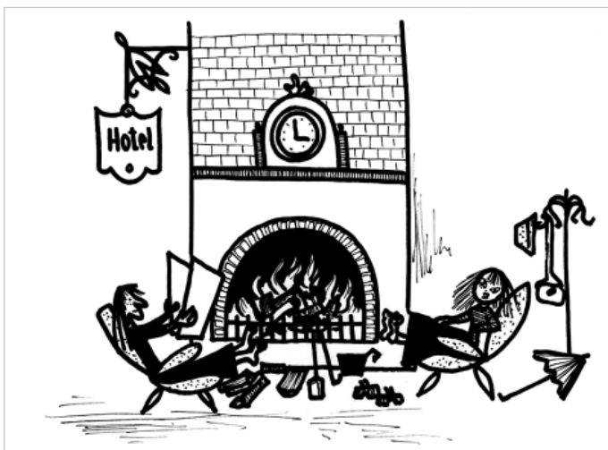
Рис. 4. Энн и Мэри

И ей снится сон: под звуки дождя она идет по мокрым улицам Лондона, пытаясь найти ближайший отель. Помогает его найти английский полицейский «Бобби» (см. рис. 2). Вскоре, удобно расположившись в кресле у камина, она знакомится с мисс Мэри Виндзор (см. рис. 4), которая, как оказалось, путешествует по Великобритании на своем автомобиле.