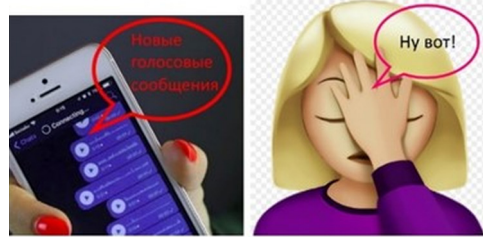
Рис. 4. Почитательница театра, получившая блок голосовых сообщений

Предтекстовый этап. Проводим со студентами беседу о том, знакомы ли они с таким понятием, как «нетикет». Даем краткую историческую справку о возникновении термина, разясняем его этимологию. Предлагаем студентам поделиться, что им больше всего не нравится, когда они общаются в Сети друг с другом и преподавателями, и есть ли какие-либо правила, которых они стараются придерживаться.