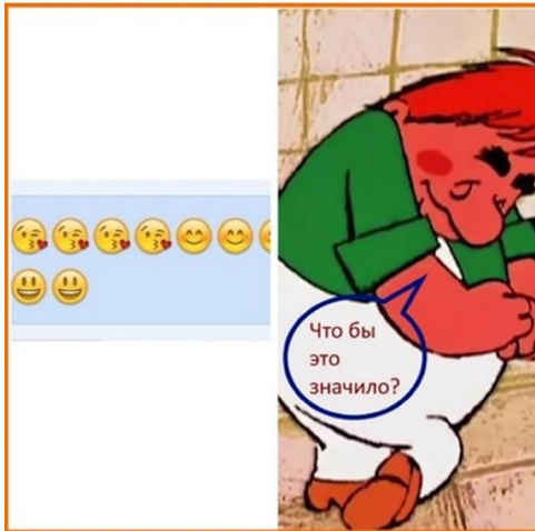
Рис. 3. Мультипликационный персонаж Карлсон, получивший сообщение в мессенджере

На рисунке 3 показано глубокое смущение мультипликационного персонажа Карлсона (студия «Союзмультфильм», 1968 год), получившего в ответ на сообщение в мессенджере череду смайлов с поцелуями.