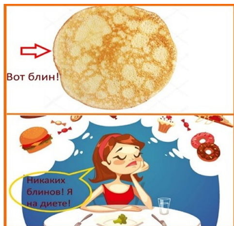
Рис. 5. Запрет на использование слов и выражений, не отвечающих литературной норме