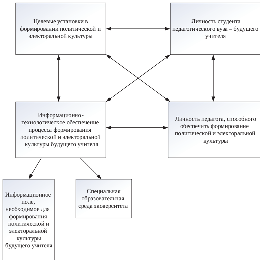
Рис. 2. Система формирования политической и электоральной культуры будущего учителя

Другая система будет показывать процесс формирования политической и электоральной культуры, это будет последовательность