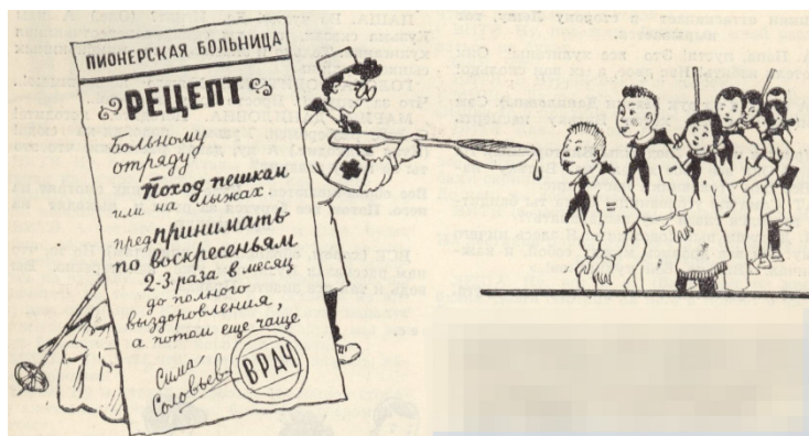
Рис. 1. Как найти дружбу

Отметим литературную подачу материала — своеобразный фирменный знак журнала «Пионер» — многочисленные