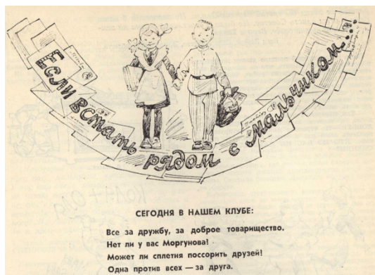
Рис. 2. «Повестка дня» клуба журнала «Пионер»

Данная публикация была итоговым ответом на заметку в несколько строк, опубликованную в № 2 за 1959 г. «Давайте ответим вместе», в которой кировоградские ученицы 7 класса задали вопрос: «Можно ли дружить с мальчиками?». В редакцию пришло двести пятьдесят писем от читателей, и все письма, по словам авторов статьи, содержали в себе утверждение, что дружить обязательно надо. В то же время в статье был проведен анализ негативных ситуаций, которые имели место в советской школе, а также читателям предложены варианты действий по решению конфликтов. Так, на сплетни и насмешки предлагалось отвечать высмеиванием сплетников в сатирических газетах, «стыдить их на суде всего отряда» [там же, с. 65], на хулиганские выходки одноклассников также отвечать самым решительным образом. Отметим, что в середине XX века умение постоять за себя, в том числе и с применением силы, относилось к положительным чертам личности: «Драться, поднимать руку на товарища пионеру нельзя, а защищать слабого нужно, необходимо. Этого требуют пионерские законы: «Пионер —