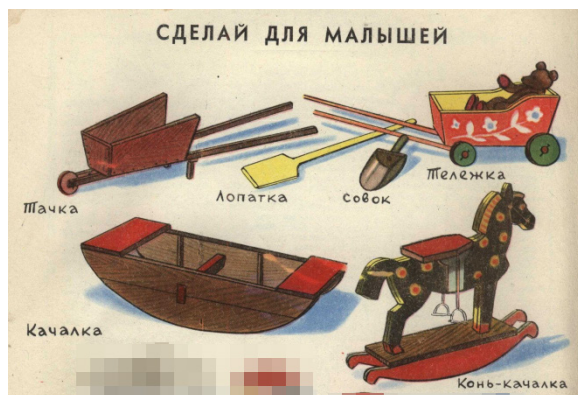
Рис. 4. Примеры самоделок для младших школьников («Пионер» 1951 г. № 6, обложка)

манере литературной подачи информации в журнале публиковались материалы о том, что понимается под товарищеским поведением. Например, во время соревнований нельзя позволять себе толкать соперника, причинять ему вред: «Наши спортсмены — прежде всего хорошие товарищи» [18, с. 55]; «Один, без товарищей, не сыграешь в хоккей, в одиночку не поставишь спектакль, сам с собой наперегонки не побегаешь, осаду снежной крепости не устроишь» [19, с. 56]; «Помощь товарищам — это обязанность хороших спортсменов... спортом хорошо заниматься тогда, когда в твоих успехах заинтересован весь коллектив, и все тебе хотят помочь, и ты сам помогаешь товарищам, когда у тебя есть сильный, достойный противник, с которым интересно соревноваться» [20, с. 51]; «...украденная слава бывает куда тяжелее, чем честно проигранный бой» [21, с. 25] и др.