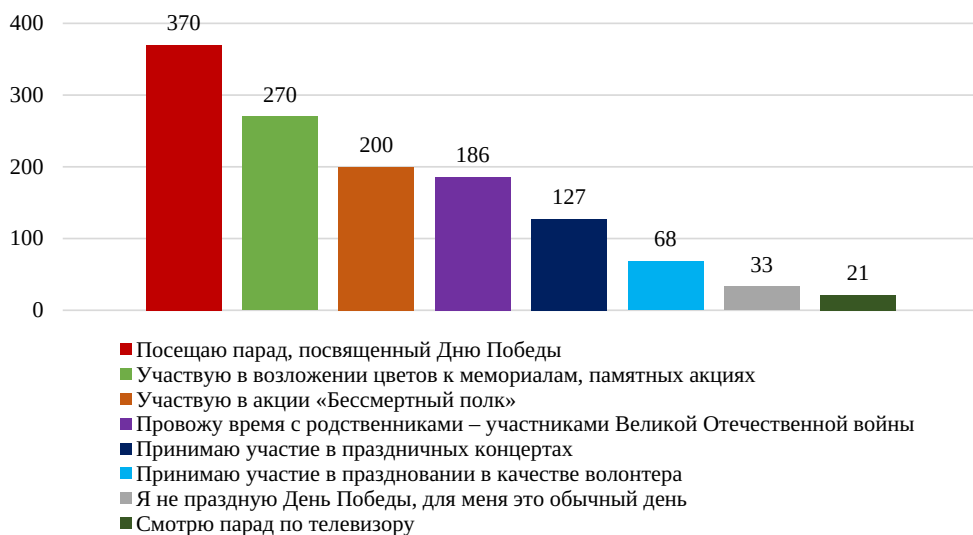
Рис. 1. Распределение ответов на вопрос: «Как вы проводите День Победы 9 мая?», кол-во человек

В пятом вопросе закрытого типа «Как вы проводите День Победы 9 мая?» (рис. 1) респонденты могли выбрать до трех вариантов ответа, а также добавить свой вариант ответа в последующем шестом вопросе: «Если в предыдущем вопросе вы выбрали вариант «Другое», поясните, как именно вы проводите День Победы 9 мая?» 61,16% респондентов при праздновании Дня Победы посещают праздничные парады; 44,63% участвуют в возложении цветов к мемориалам и в памятных акциях; 33,06% ответили, что участвуют также в акции «Бессмертный полк»; 30,74% проводят время с родственниками – участниками Великой Отечественной войны; 20,99% принимают участие в праздничных концертах, а 11,24% участвуют в праздновании в качестве волонтеров. 3,4% респондентов также указали, что не посещают парад, но смотрят его трансляцию по телевизору. Однако 33 респондента (5,4%), 18 из которых родились в Санкт-Петербурге, отметили, что не празднуют День Победы, который является для них обычным днем.